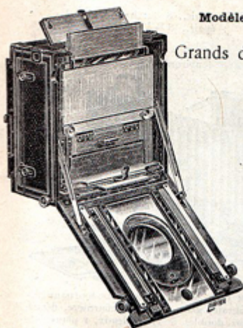
Fig 96 — Position pour court foyer avec décentrement vertical.

Grands décentremets, même pour court foyer, double et triple tirage, pour long foyer