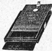
CHASSIS NÉGATIFS DOUBLES à volets, modèle DMR (breveté S. G. D. G.)