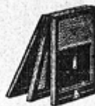
CHASSIS NÉGATIFS DOUBLES à rideaux.