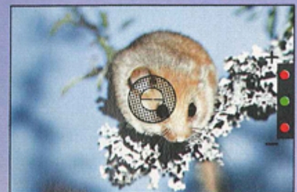
Sucher der »EDX 3« mit Leuchtdioden und Schnittbild-Entfernungsmesser