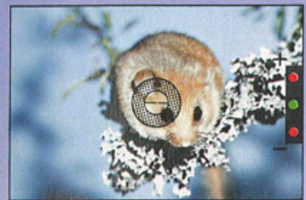
Sucher der »EDX 3« mit Leuchtdioden und Schnittbild-Entfernungsmesser

EXAKTA® »EDX 3« 1:1,7/55 mm ② 589.- O. Motor