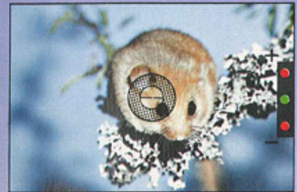
Sucher der »EDX 3« mit Leuchtdioden und Schnittbild-Entfernungsmesser

EXAKTA® »EDX 3« 1:1,7/55 mm ② 589.- O. Motor