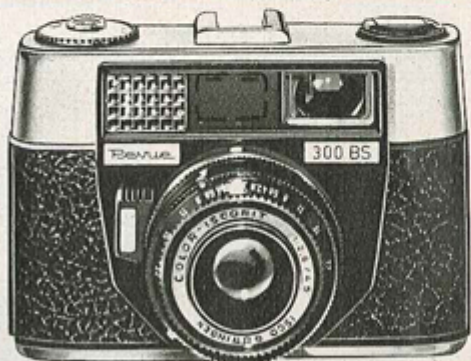
Preis- senkung! ④ REVUE 300 BS 89.- Anz. 9.-