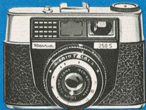
NEU! ② REVUE 250 S 3950