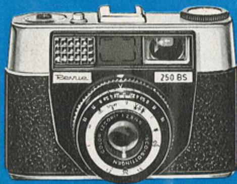
NEU! ③ REVUE 250 BS 69.- Anz. 7.-