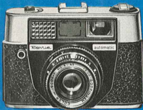
NEU! ⑤ REVUE-Automatic 119.- Anz. 12.-